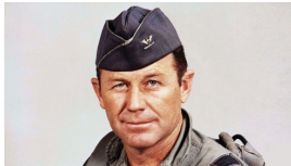
Chuck Yeager «The Right Stuff»