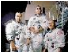
Mannskapet på Apollo 8: Jim Lovell, Bill Anders og Frank Borman